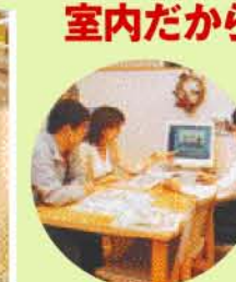
▲イメージプラン作成サービス