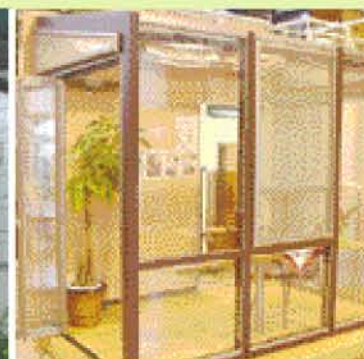
ガーデンサンルーム